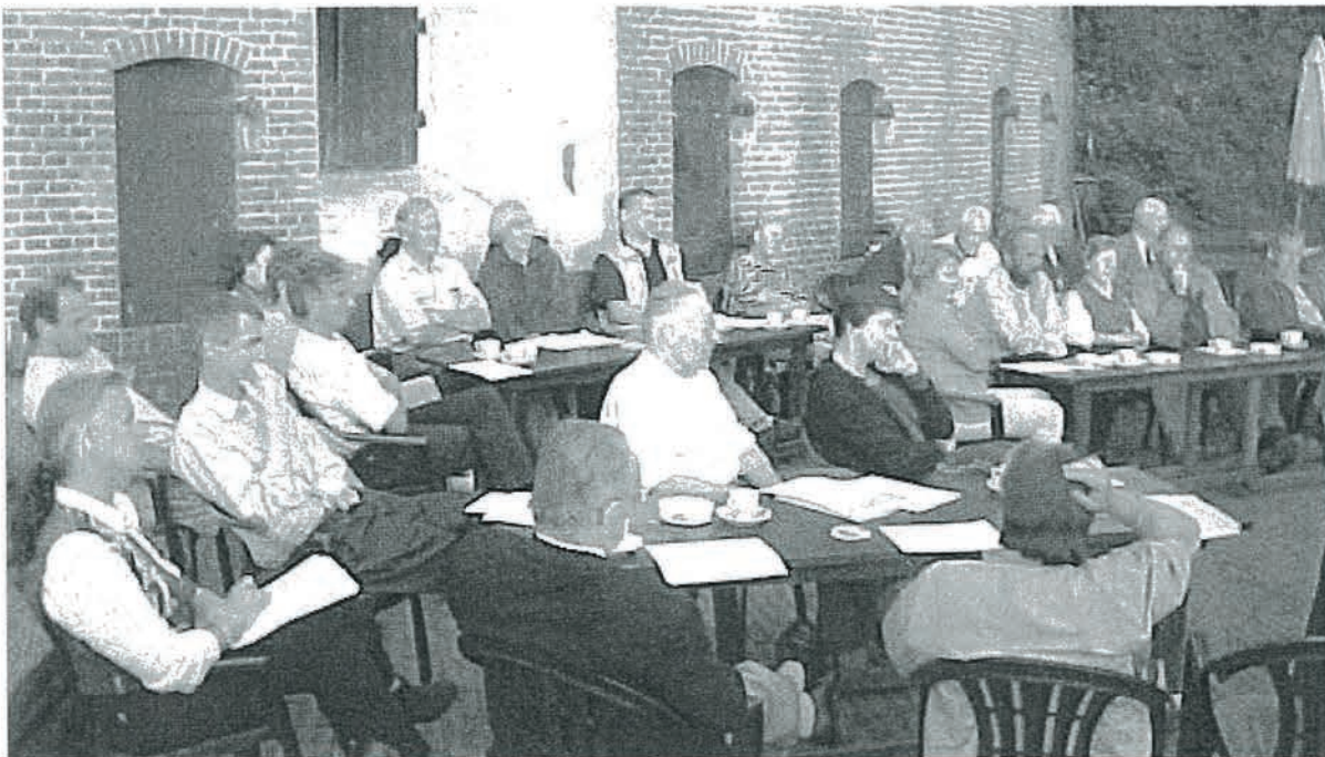
Mooi weer tijdens de Algemene ledenvergadering 2001 in Fort Asperen

De kandidaten die zich recent hebben aangemeld zullen tijdens de komende Algemene Ledenvergadering worden voorgedragen als bestuurslid van onze Vereniging. U kunt meer informatie aantreffen hierover op de laatste pagina van deze uitgave.