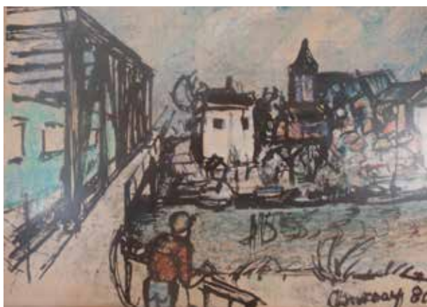
Gezicht op Tricht, pentekening door Jan v. Anrooy (1980)

De VBL heeft de gemeente bevraagd waarom zij niet met Prorail in overleg is gegaan om in plaats van hoge perspex geluidsschermen alsnog de lage schermplaatjes (75 cm hoog) direct