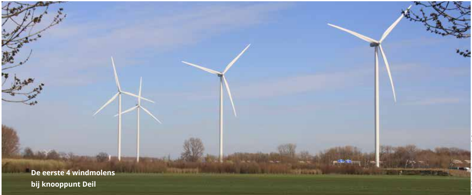
De eerste 4 windmolens bij knooppunt Deil