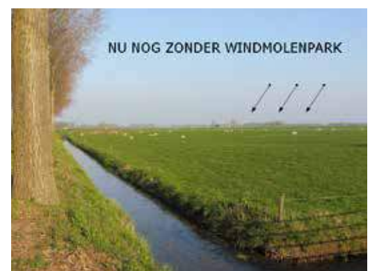
C: Straks zijn vanuit de het hele Lingegebied de 200 meter hoge windmolens te zien.

Dit project is door Betuwewind gelijktijdig met de 11 windmolens bij het knooppunt Deil ontwikkeld. Op dit moment worden in het natuurgebied van Staatsbosbeheer de funderingen aangelegd voor deze giganten. Het wordt spannend! De zichtbaarheid zal enorm zijn. Hoe zullen we dat beleven? Nog even genieten van het landschap zonder windmolens en straks trots zijn op de windmolens? (foto B & C)