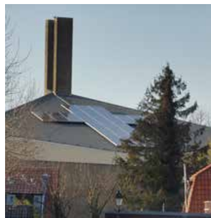
F: Bethelkerk, een groene kerk in Leerdam.

En dan het steeds groeiende aantal zonnepanelen op daken van woonhuizen. Bewoners grijpen de kans op subsidie aan, willen hun steentje bijdragen aan de energietransitie. Soms lijkt het dat men dan maar op de koop toeneemt, dat het aanzien van het huis er door aangetast wordt. En helaas betekent dit ook hier en daar een aantasting van het landschapsbeeld. De karakteristieke woonhuizen in onze dorpen en langs de dijken in het rivierengebied zijn onlosmakelijk en bepalend voor dat landschapsbeeld. De vraag rijst of collectieve zonneparken een oplossing zouden zijn om verdergaande verrommeling te voorkomen (foto G).