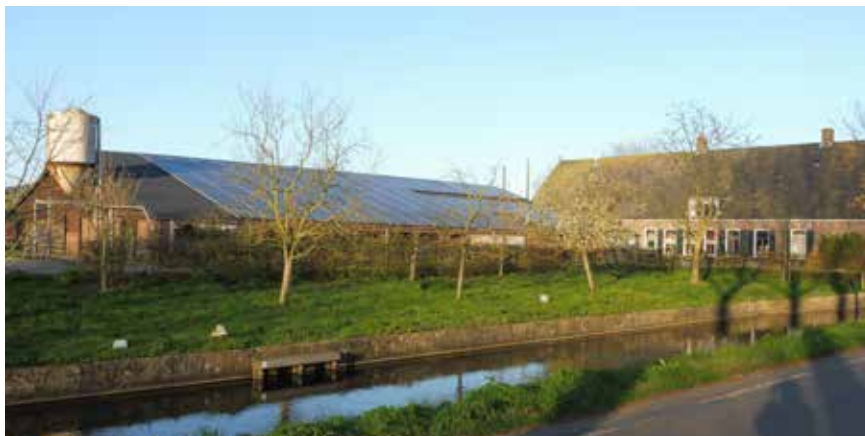
E: Zonnepanelen naast historische boerderij.