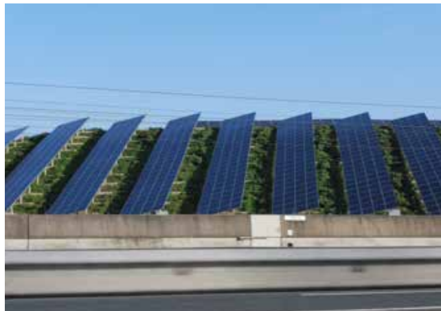
A: Zicht vanuit de auto op het AVRI zonnepark.

Het zonnepark op het AVRI terrein langs de A15: 34.000 zonnepanelen op de vuilstortheuvel zijn goed voor groene energie voor 3000 huishoudens. Het maakt slim gebruik van grond, die voor landbouw of bebouwing niet bruikbaar is. De zichtbaarheid vanuit de A15 is weliswaar groot, toch passend bij het bedrijfsgebied en industriële karakter van deze strook (foto A).