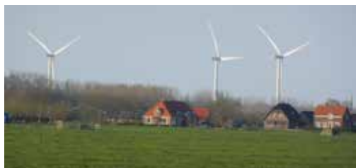
D: Zicht vanuit Hei- en Boeicop richting Vianen.

De windmolens bij Culemborg en Vianen, zijn weliswaar niet in het kerngebied van het Lingeland-schap, maar tonen goed aan hoe ver de optische uitwerking strekt (foto D).