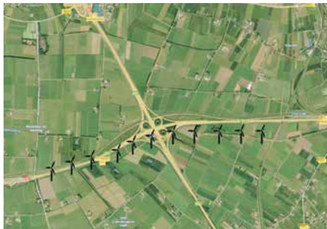
B: Een lint van windmolens langs de A15 bij Deil.