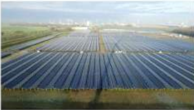
Zouden we zo iets willen in het Rivierengebied?