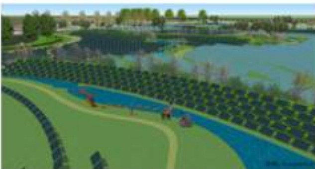
Ontwerp van een goed ingepast zonnepark in een wandelgebied