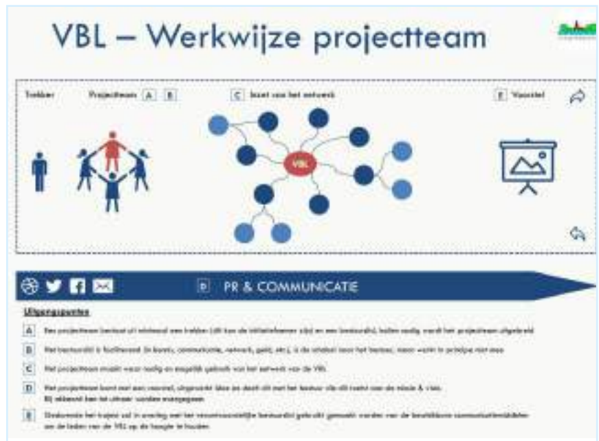
De werkwijze van werkgroep tot resultaat

Het is nu al gebleken, dat werkgroepen heel slagvaardig zijn. Doordat een kleine groep zich intensief met één thema bezig kan houden zijn snel resultaten te boeken. Deelnemen aan een werkgroep blijkt aantrekkelijk te zijn, omdat men een thema kiest dat aansluit bij je interesse en deskundigheid en de tijd die aan het project besteed wordt, overzichtelijk is. Geen verplichting voor jaren dus.