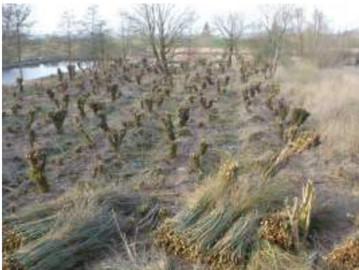
Het cultuurlandschap heeft de mens nodig: werkend, denkend, sturend