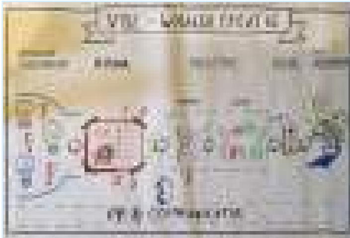
al schetsend wordt in een werkgroep de structuur ontwikkeld...