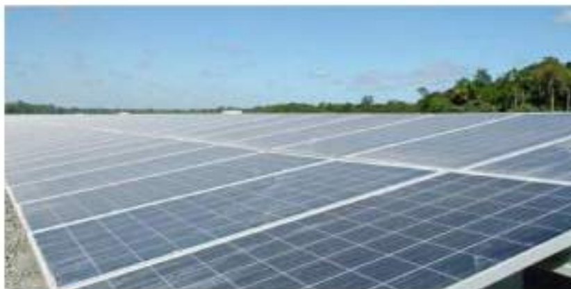
Zoiets zou het in het Lingedal geworden zijn.

Een gemeente moet onderbouwen waarom een nieuwe bestemming juist op die ene plek moet komen. Dat heet in het dagelijks gebruik 'de ladder van duurzame verstedelijking'.