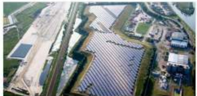
Zonnepark op een voormalig stortterrein. Ingepast op industrieterrein.

En trouwens: er zijn ook leuke ontwerpen van zonneparken te maken! Landelijk ontstaan er mooie voorbeelden. Die willen we gaan verzamelen. Mocht je elders goede voorbeelden van een zonnepark hebben gezien, laat het ons dan weten!