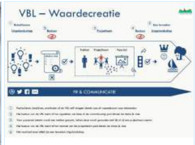
...en vervolgens in een schema uitgewerkt, dat de handleiding voor de activiteiten gaat vormen.